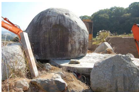
吉備津彦神社（岡山・一宮）大石の切出し（60t）