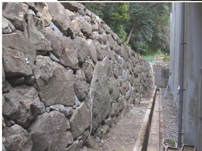
宇和島城石垣修復