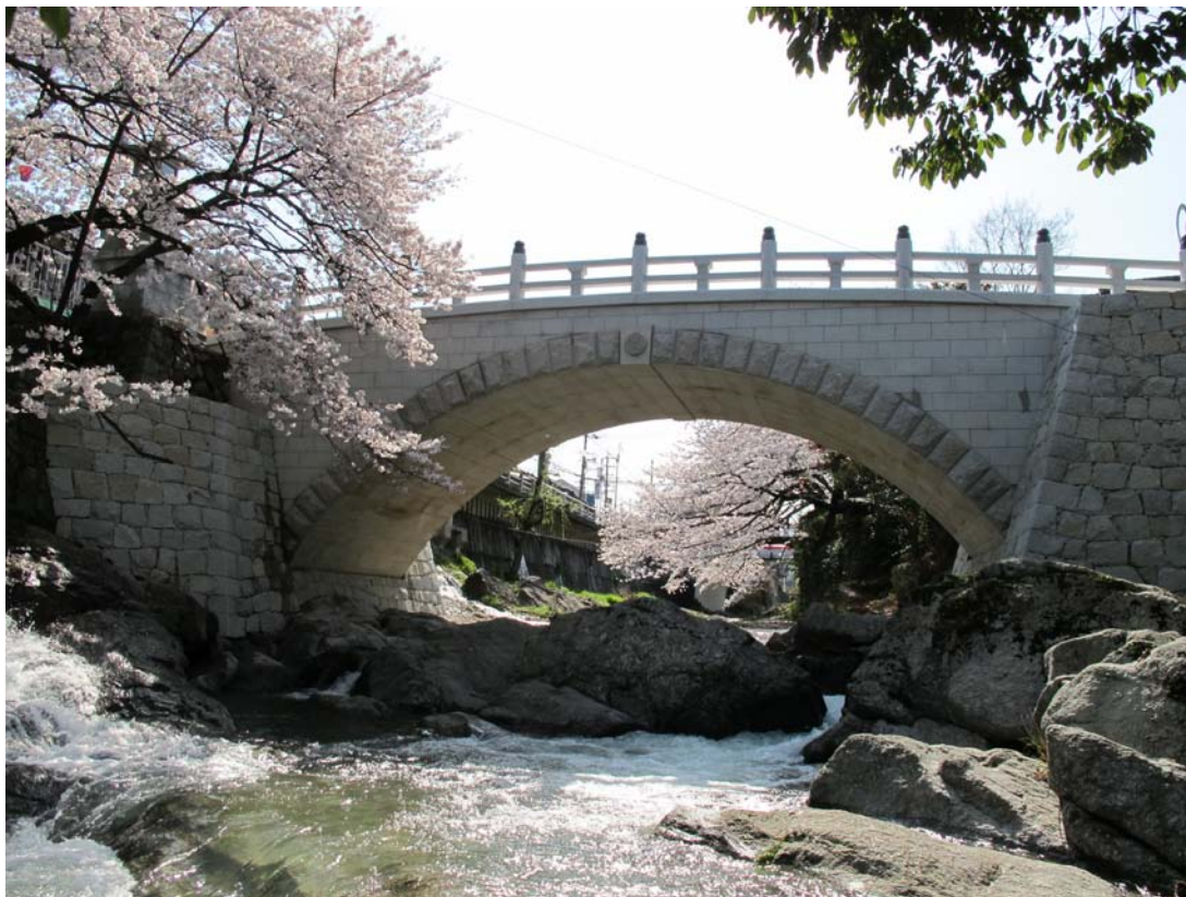
水間寺「厄除橋付替工事」