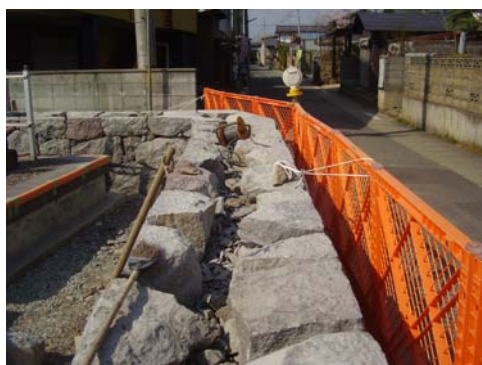
三方寺土塀（山形県）