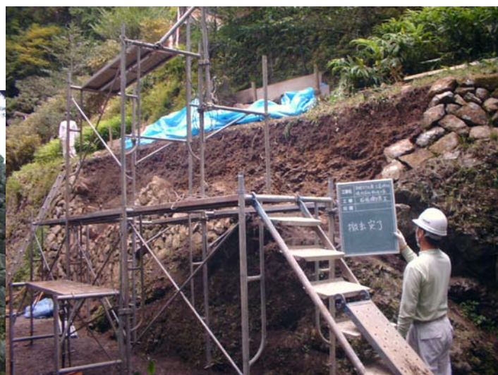
十津川村玉置神社石垣修理