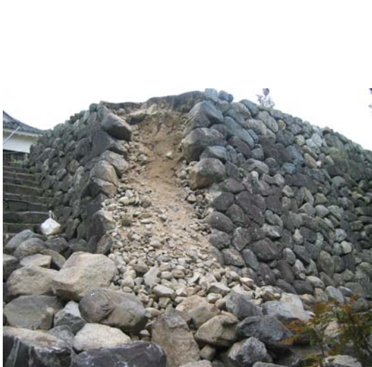
亀山城石垣解体修理